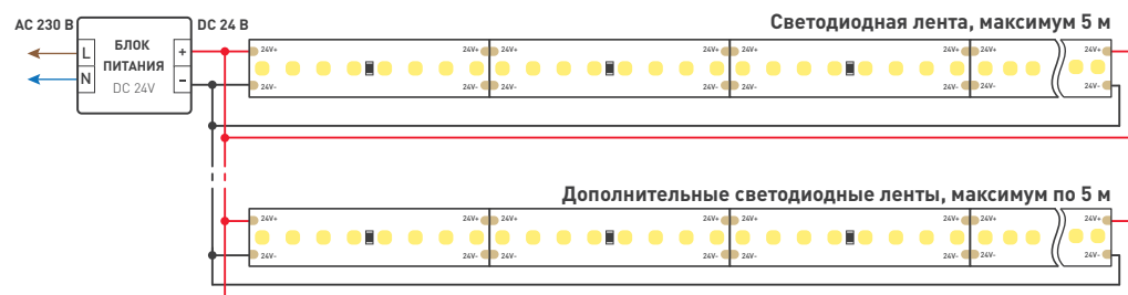
Схема 1. Подключение нескольких светодиодных лент с двух сторон